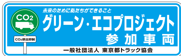
「グリーン・エコプロジェクト」参加ステッカー

グリーン・エコプロジェクトのエコドライブ活動により、CO 2 排出量・燃料の削減、燃費向上、事故低減を実現。